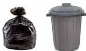
EXEMPLE DE BACS NON CONFORMES

Les 27 et 29 mai, le SEMOCTOM [Syndicat de l'Entre-deux-Mers Ouest pour la Collecte et le Traitement des Ordures Ménagères] a procédé à la distribution de bacs de collecte répondant aux dernières normes. A ce titre, nous vous rappelons qu'à compter du mois d'octobre, seuls les bacs conformes seront ramassés. Nous vous remercions par conséquent de veiller à ne plus utiliser de contenants non délivrés par le SEMOCTOM, dès début juin.